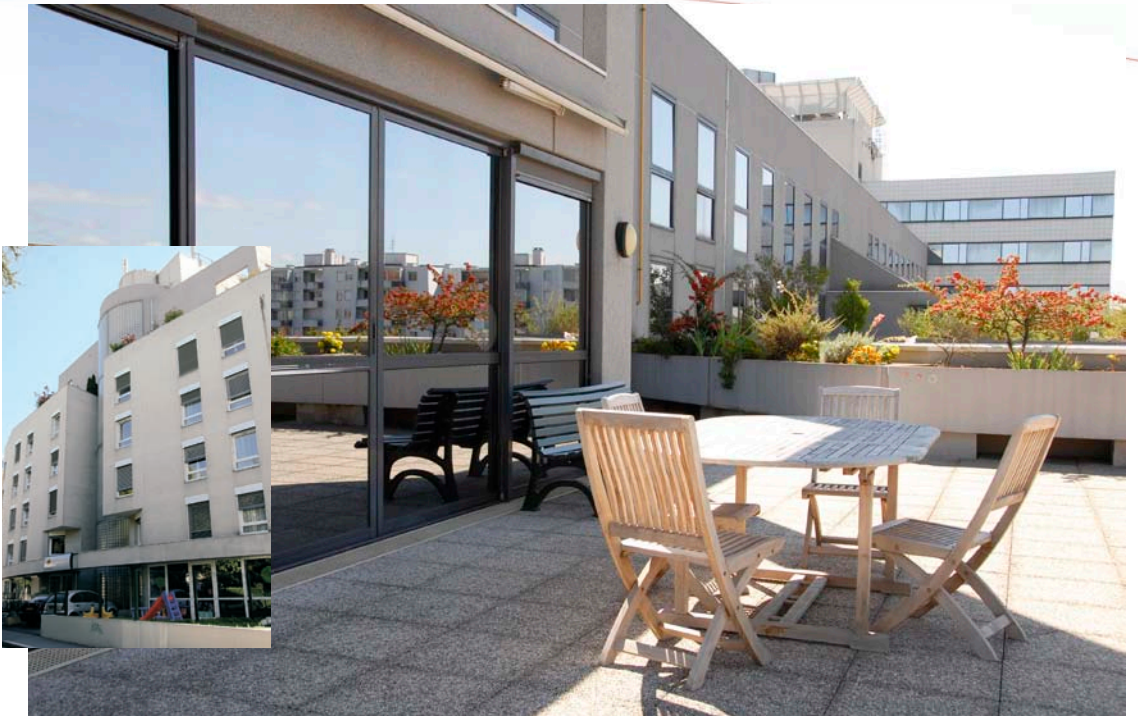
Etablissement d'Hébergement pour Personnes Âgées Dépendantes (EHPAD de 92 lits)

Au coeur du centre ville, dans un environnement urbain et humain, l'établissement « Les Cristallines » est intégré dans un quartier entièrement rénové et résidentiel. Bénéficiant d'une terrasse panoramique sur la ville de Lyon, l'établissement accueille des personnes âgées de plus de 60 ans valides et/ou dépendantes. Les 92 lits sont répartis sur 5 unités de vie, dont une unité spécifique de 10 lits réservée aux personnes présentant des troubles de l'orientation. Une halte-garderie « Les Lucioles », située au rez-de-chaussée de l'établissement, permet des échanges intergénérationnels réguliers et enrichissants.