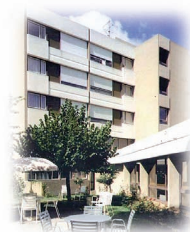
Résidence Le Pary

ACPPA Accueil et Confort Pour Personnes Agées