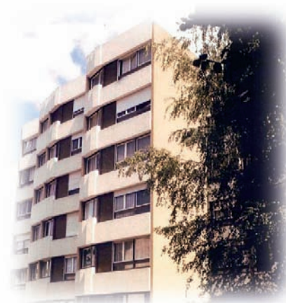
Résidence La Chacunière