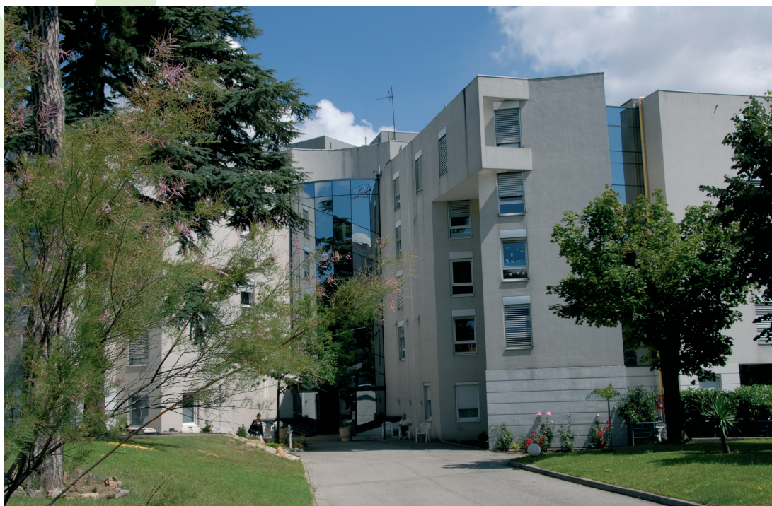
Etablissement d'Hébergement pour Personnes Âgées Dépendantes (EHPAD de 86 lits)

Dans le quartier Saint-Irénée, proche de la gare de Perrache, l'établissement « Les Amandines », offre un cadre de vie idéal. D'une capacité de 86 lits (chambres individuelles ou à deux lits), la résidence se dresse sur 4 étages dans un vaste parc arboré, et jouit d'une magnifique vue panoramique sur Lyon. Une unité spécifique est réservée aux personnes présentant des troubles de l'orientation qui bénéficient d'un encadrement adapté et de soins individualisés. Une équipe pluridisciplinaire et attentive accueille en séjour temporaire ou permanent des personnes âgées de plus de 60 ans.