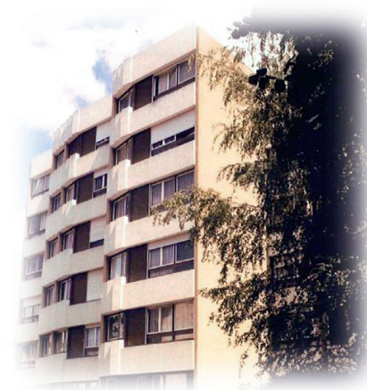
Résidence La Chacunière