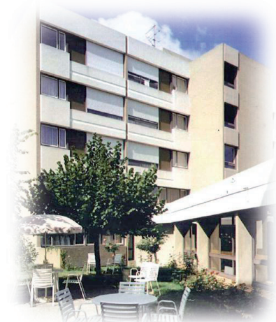
Résidence Le Pary

ACPPA Accueil et Confort Pour Personnes Agées