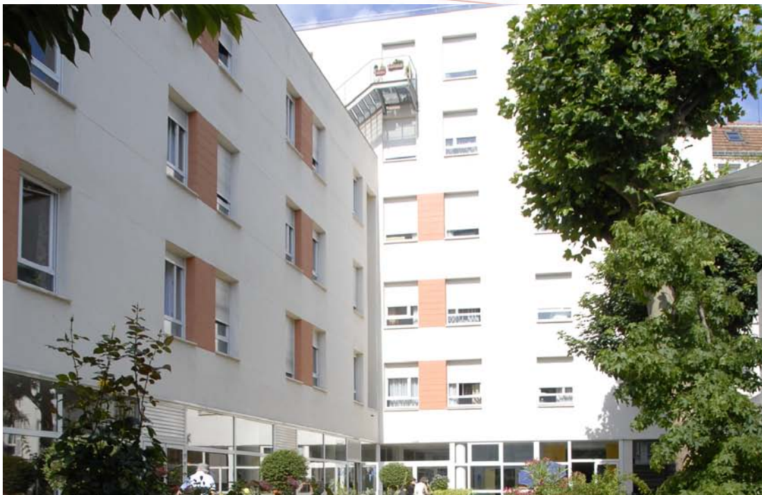
Etablissement d'Hébergement pour Personnes Âgées Dépendantes (EHPAD de 94 lits)

Près de Port Royal, dans le 13 ème arrondissement de Paris, « Péan » offre un environnement urbain et humain privilégié : marché hebdomadaire, boutiques, restauration, jardins... La crèche « Bout' Chou », installée dans l'établissement, permet de favoriser les échanges entre les générations. L'établissement accueille en séjour temporaire ou permanent les personnes âgées de plus de 60 ans. Avec ses 94 lits, dont certains sont destinés aux personnes âgées présentant des troubles de l'orientation, « Péan » est une résidence pour trouver douceur, calme et sérénité.