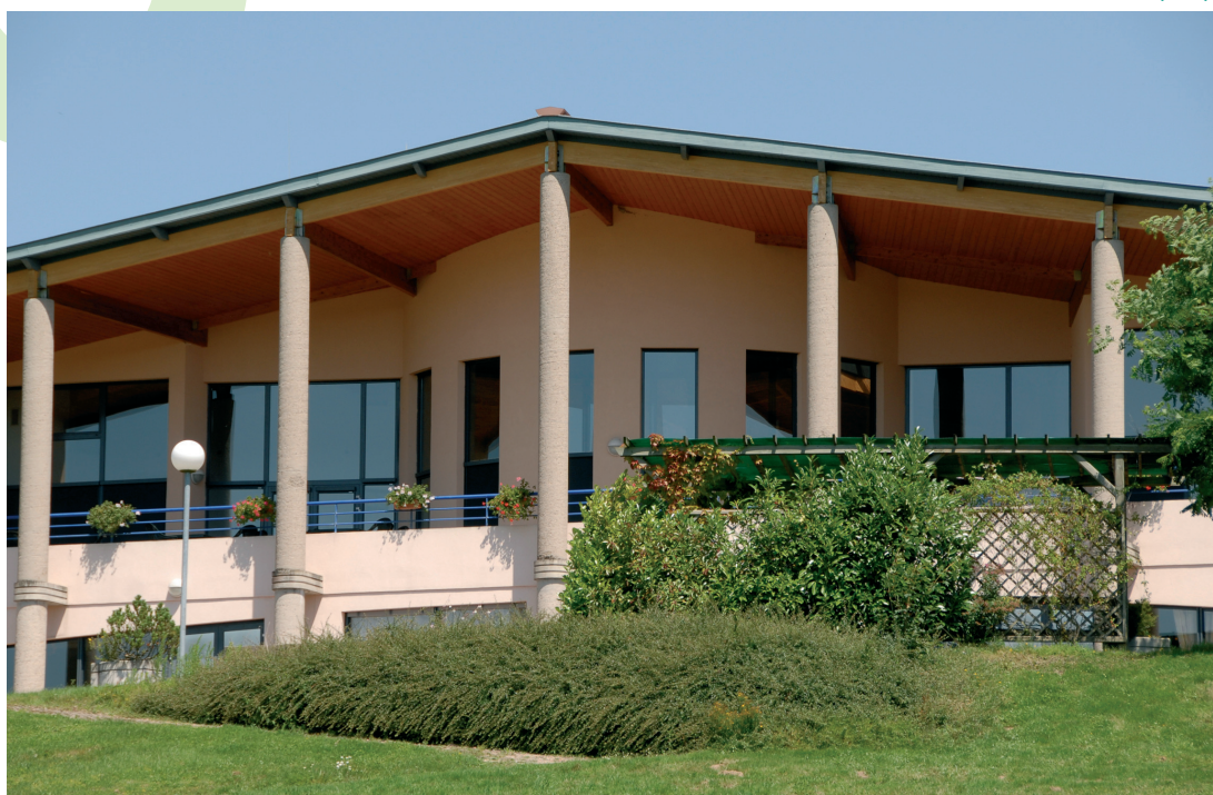
Etablissement d'Hébergement pour Personnes Âgées Dépendantes (EHPAD de 56 lits)

Situé dans les Monts du Beaujolais, au cœur de la nature, l'établissement « La Boissière » accueille des personnes âgées de plus de 60 ans dans un lieu de vie chaleureux et reposant.