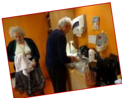
Les jus de fruit naturel !!!!