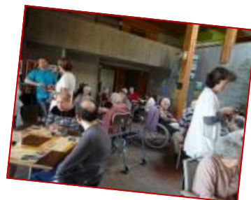
Le beaujolais nouveau